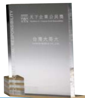
天下雜誌—天下企業公民獎