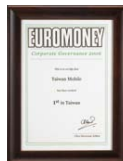
Euromoney—台灣地區公司治理第一名