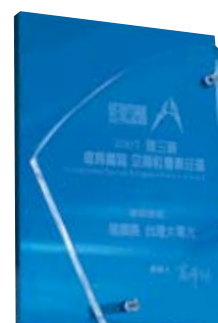
遠見雜誌 企業社會責任獎—楷模獎