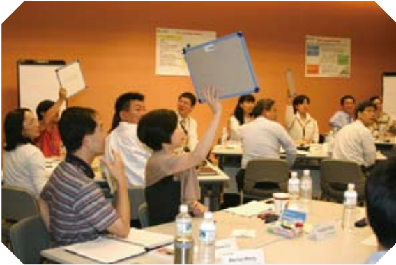
▲ 全員投入ECE專案，研討提升顧客經驗

有關勞工安全衛生相關之規範及文件，均揭示於內部公開網站上，提供每位員工隨時參閱。主要執行措施內容摘要如下：