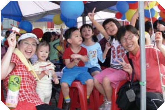
▲ 每年舉辦員工親子日Family Day